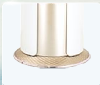
Chân đế thiết kế dạng kim cương độc đáo