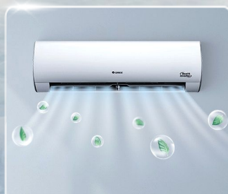
Real Cool mát lạnh tự nhiên trong 3 phút